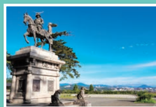
仙台城址 Site of Sendai Castle