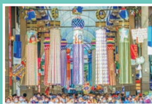
仙台七夕まつり Sendai Tanabata Festival

東北地方で一番大きな街で自然が多いです。 仙台駅から仙台空港までは電車で約30分、仙台駅から東京駅までは新幹線で1時間30分とアクセスも良く国内はもちろん、海外への移動も便利です。